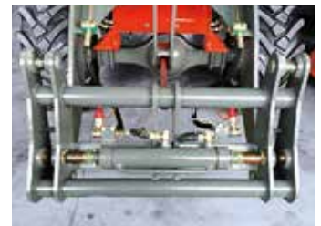
Schnellwechsler ERT1500: EURO-Norm